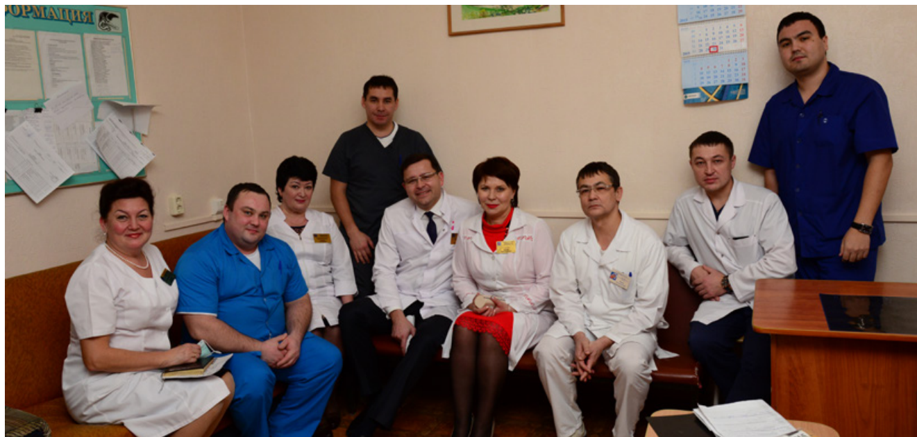
Сотрудники отделения хирургии